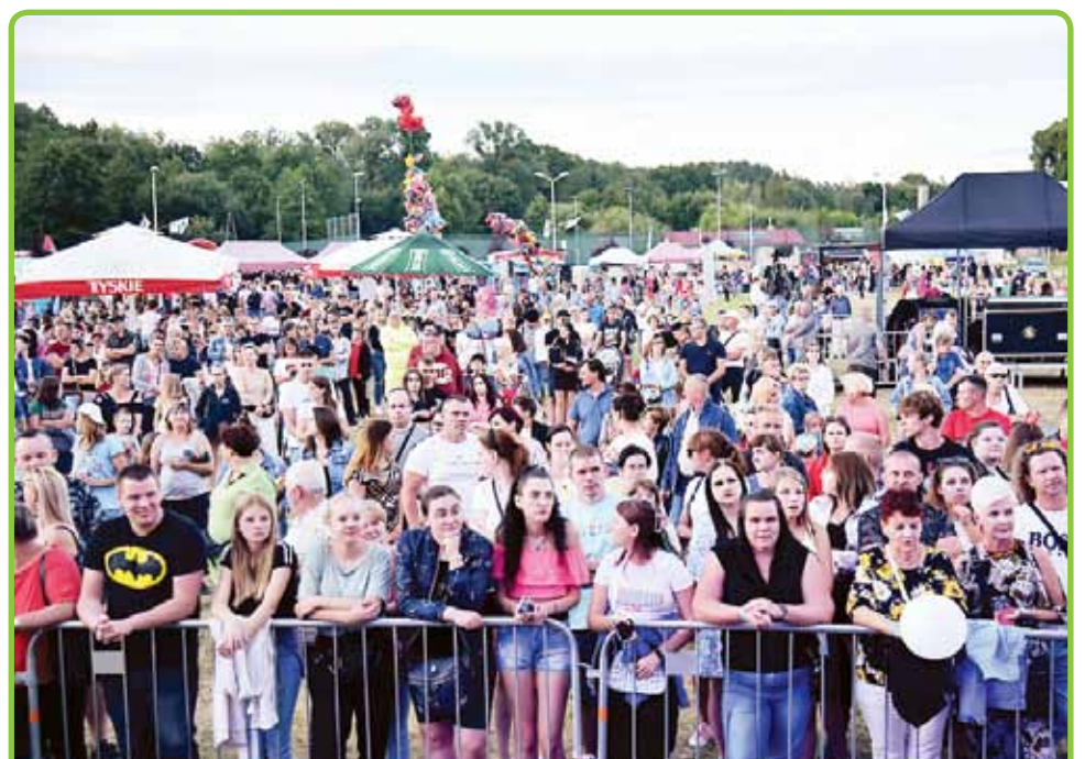
DNI LIDZBARKA 2022