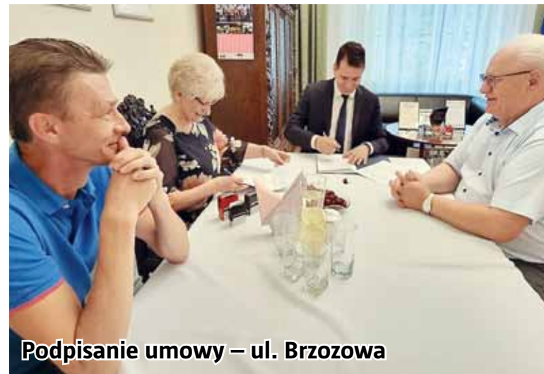
Podpisanie umowy – ul. Brzozowa