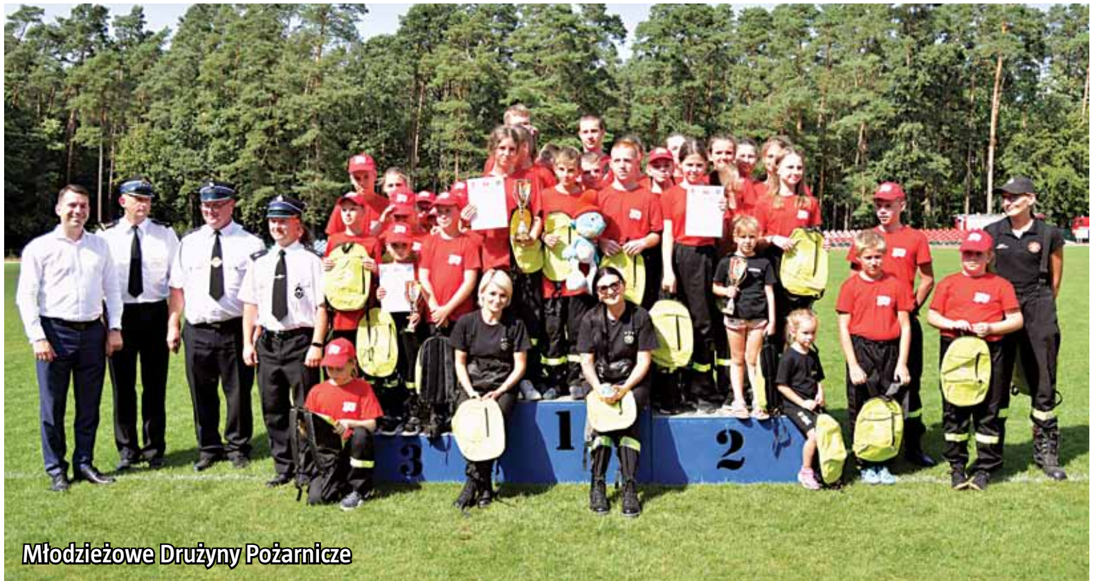
Młodzieżowe Drużyny Pożarnicze

Drużyny znajdujące się na podium zostały uhonorowane pucharami, pamiątkowymi dyplomami oraz nagrodami. Dekoracji dokonali: burmistrz