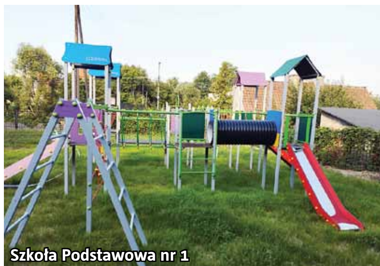
Szkoła Podstawowa nr 1

W Przedszkolu Miejskim w Lidzbarku w 2 salach dy-