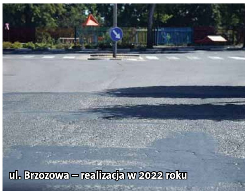
ul. Brzozowa – realizacja w 2022 roku