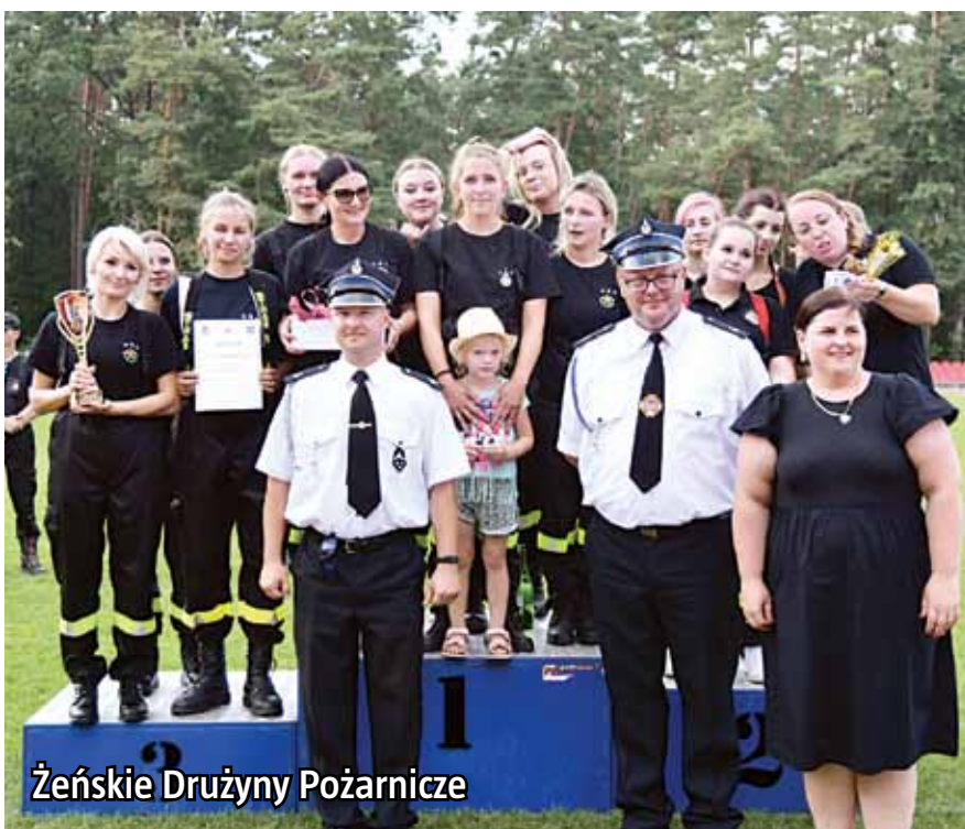
Żeńskie Drużyny Pożarnicze

24 września o godz. 11:00 na stadionie miejskim w Lidzbarku odbędą się Powiatowe Zawody Młodzieżowych Drużyn Pożarniczych.