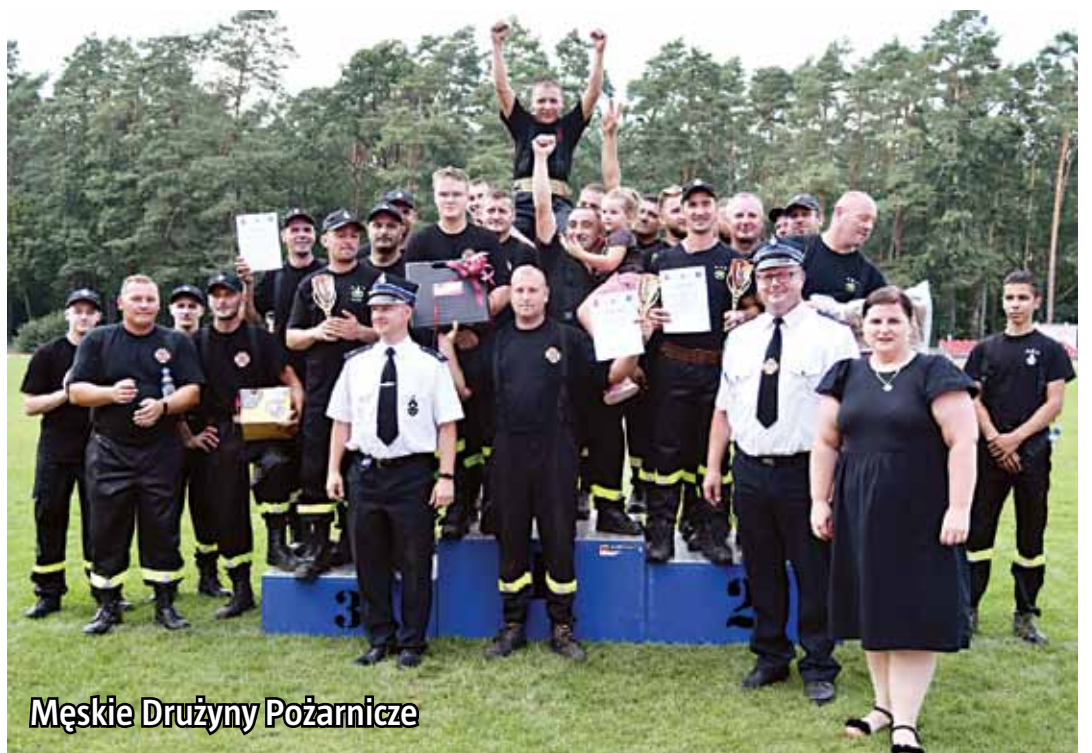
Męskie Drużyny Pożarnicze