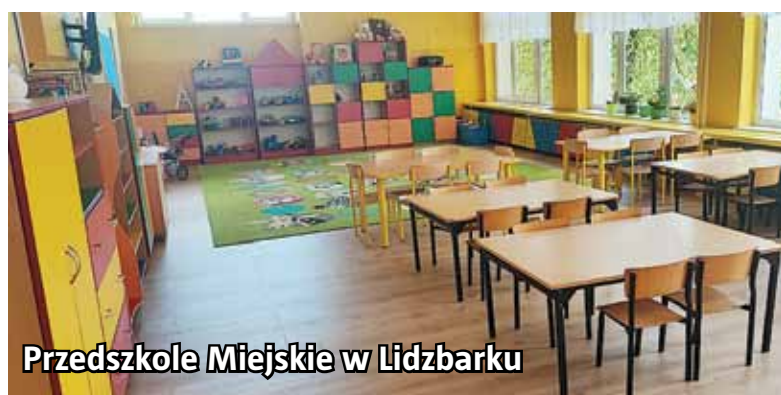
Przedszkole Miejskie w Lidzbarku