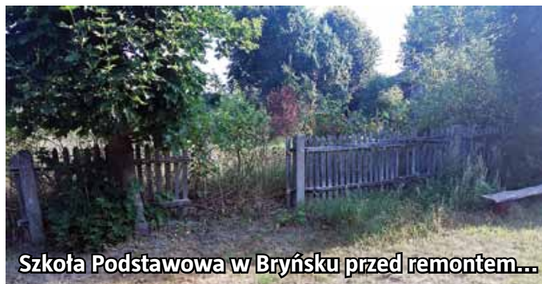
Szkoła Podstawowa w Bryńsku przed remontem...