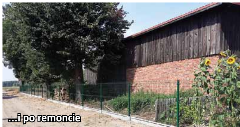
...i po remoncie