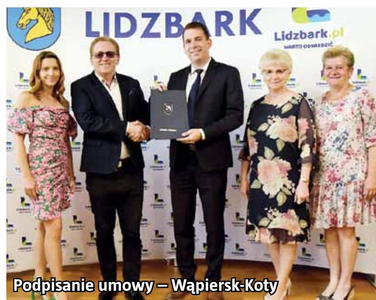
Podpisanie umowy – Wąpiersk-Koty